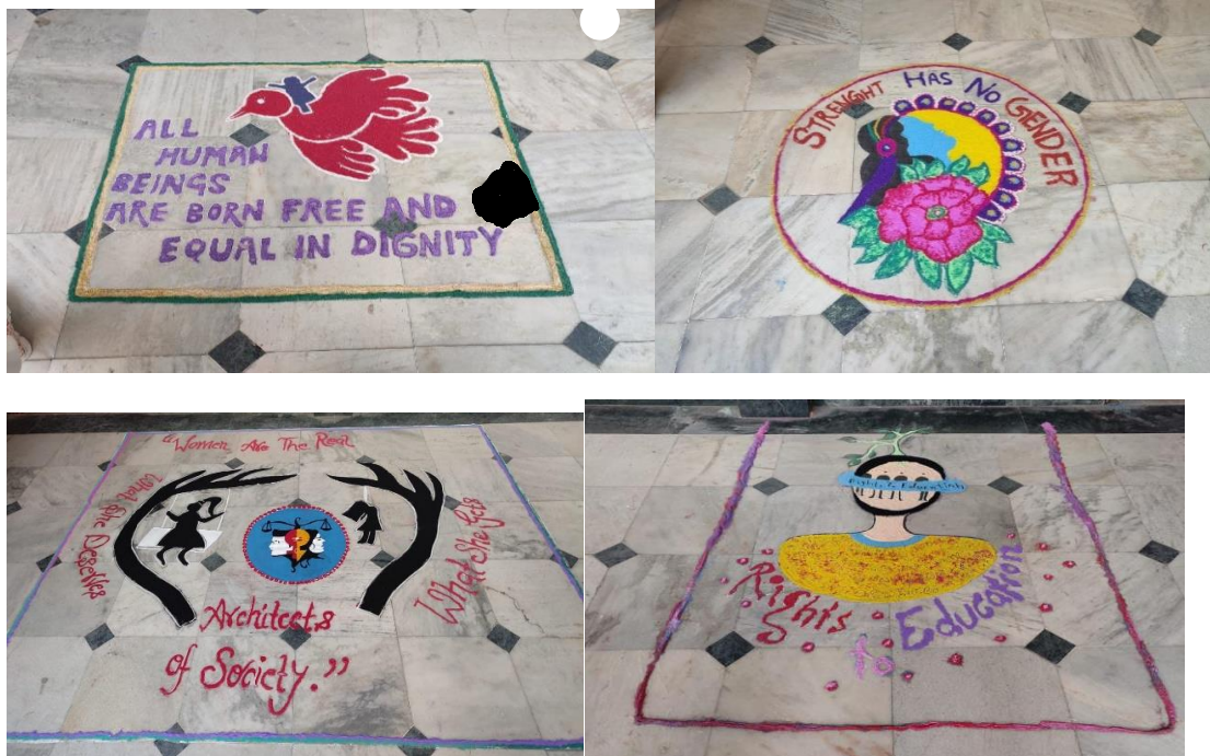
Rangolis Made by NSS Volunteers