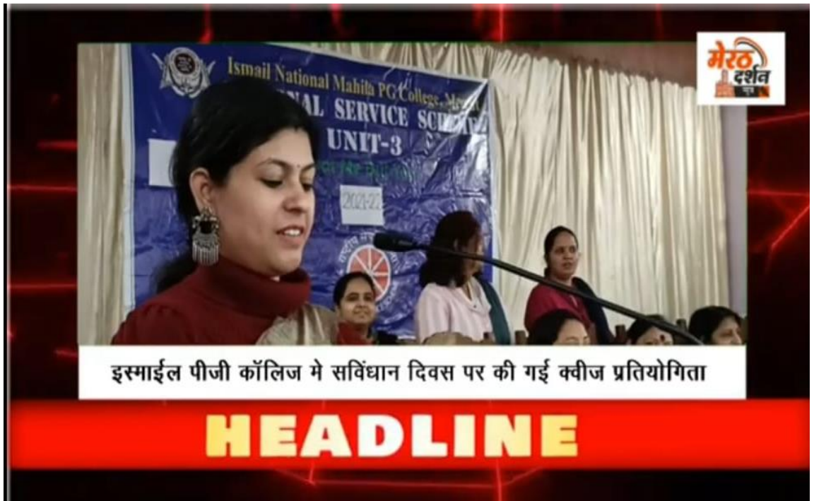
इस्माईल पीजी कॉलिज मे सविधान दिवस पर की गई क्वीज प्रतियोगिता