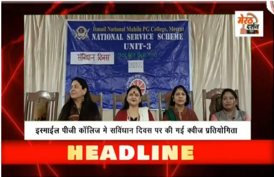
इस्माईल पीजी कॉलिज मे सविधान दिवस पर की गई क्वीज प्रतियोगिता