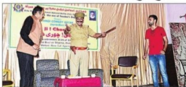
इस्माईल महिला पीजी कॉलेज में आयोजित नाटक का मंचन करते कलाकार।