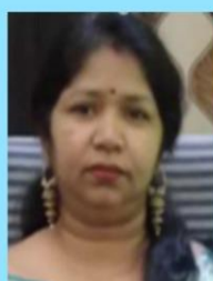
KEY NOTE SPEAKER

Financial Education and Awareness Programme